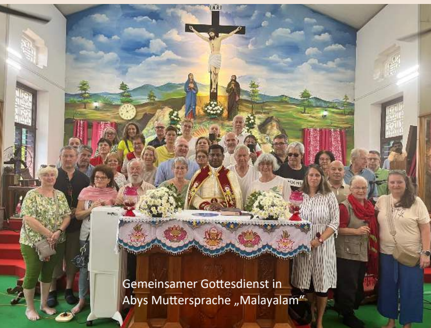
Gemeinsamer Gottesdienst in Abys Muttersprache „Malayalam“

Wir waren jedes Mal aufs Neue über die indische Kultur und Mentalität, Freundlichkeit, Offenheit und Neugier uns Europäern gegenüber überrascht.