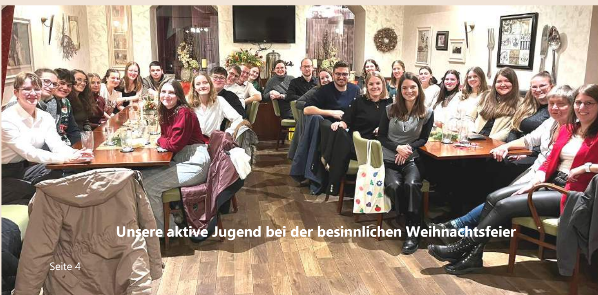
Unsere aktive Jugend bei der besinnlichen Weihnachtsfeier

Auch die eingenommen Spenden bei der „Nacht der 1000 Lichter“ in der Höhe von Euro 1.500,- wurden für einen sozialen Zweck verwendet und an die Hochwasseropfer weitergeleitet.